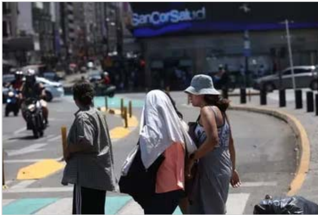
Alerta roja. Calor sofocante en la Ciudad y provincia de Buenos Aires: las térmicas llegan a los 39 grados