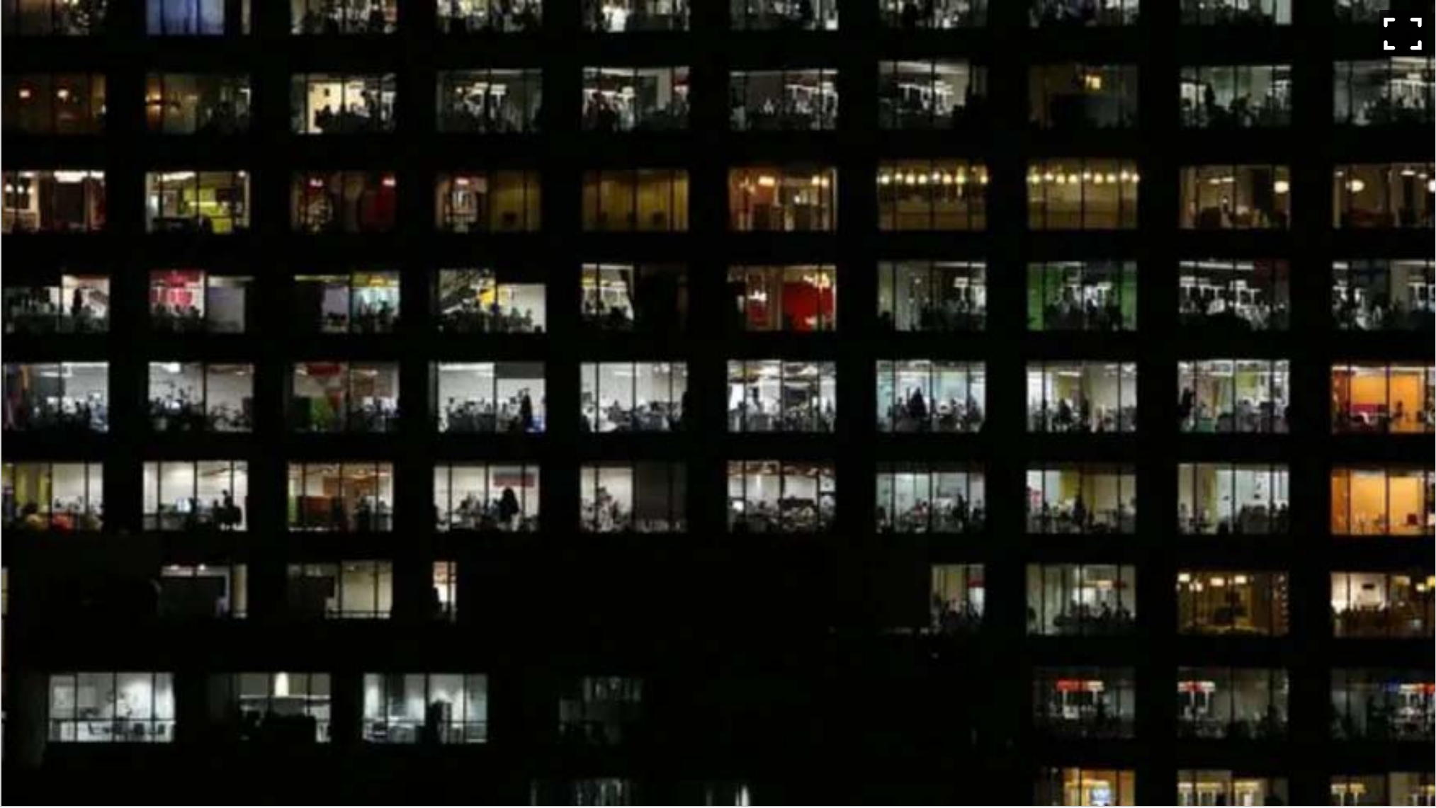
Menos horas de trabajo equivale a menos gasto de energía.

No sólo se trata de una idea atractiva, más allá de las posibilidades de diversión que brindaría un día extra: también podría ser una medida fácil para mejorar radicalmente el medioambiente y nuestra economía.