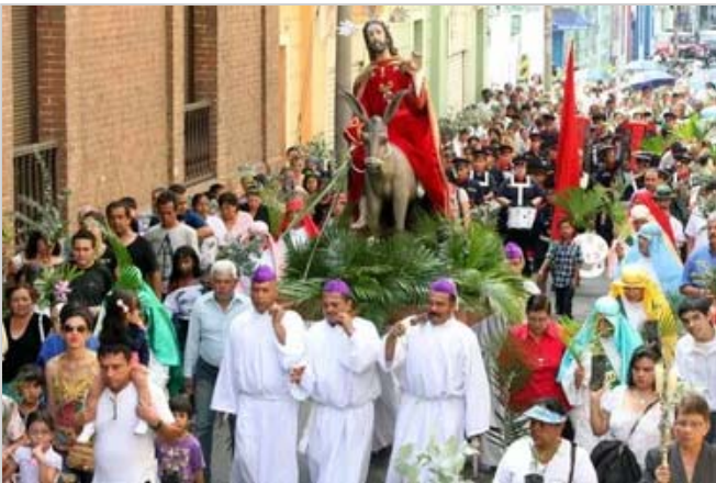
Pascua 2023. ¿Cuándo cae Semana Santa y qué se celebra cada día?