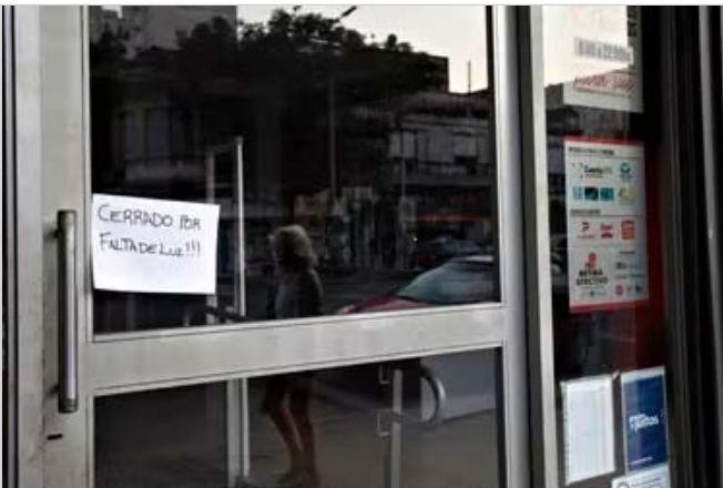
Ola de calor. Se registró un nuevo récord de consumo eléctrico y más de 45 mil usuarios están sin luz