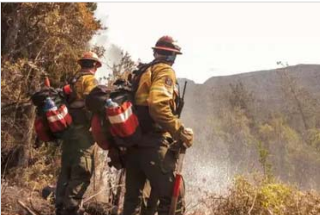
El Bolsón. Lograron contener el incendio: cuáles fueron los daños que dejó el fuego en la zona