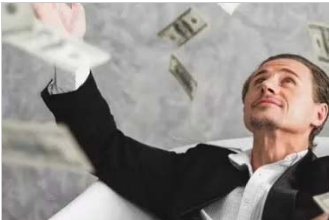
¿El dinero puede comprar felicidad? Los científicos dicen que posiblemente sí