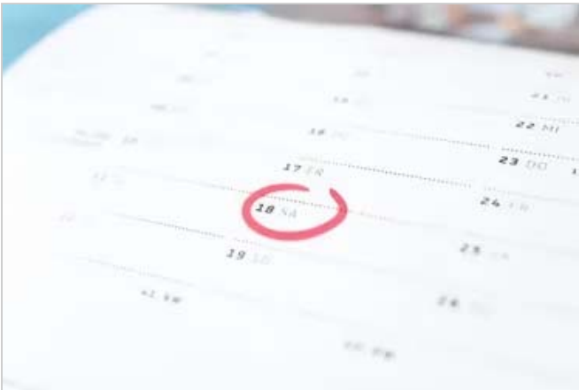
Tras el Carnaval. ¿Cuándo es el próximo feriado?