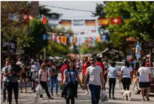
Este mes. ¿Cuándo es el próximo fin de semana largo?