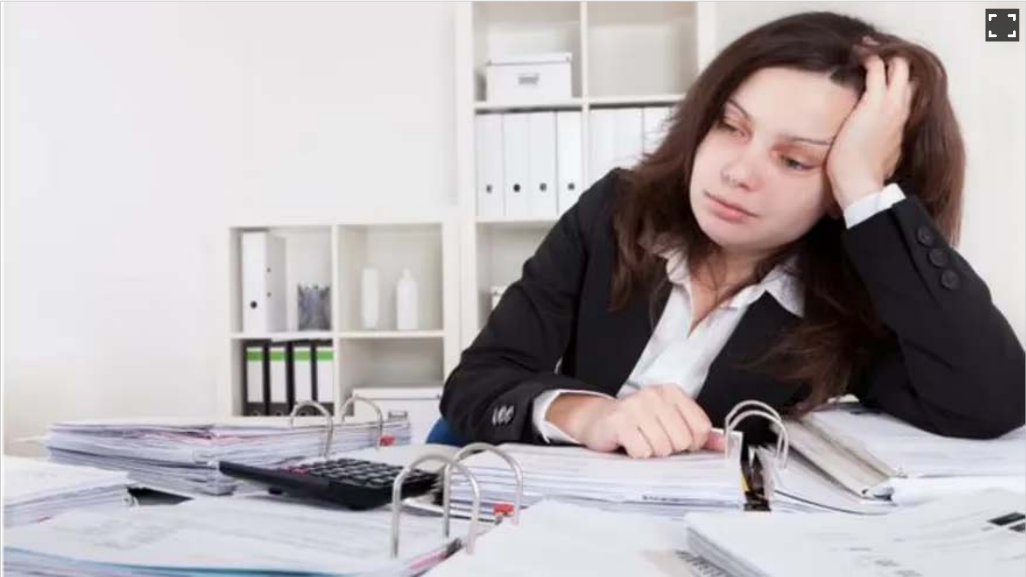
Varios estudios indican que reduciendo las horas de trabajo se pueden evitar afecciones de salud relacionadas con el trabajo

En 2007, el estado de Utah, en Estados Unidos, redefinió las semanas laborales de sus empleados públicos extendiendo las horas de lunes a jueves para eliminar las de los viernes.