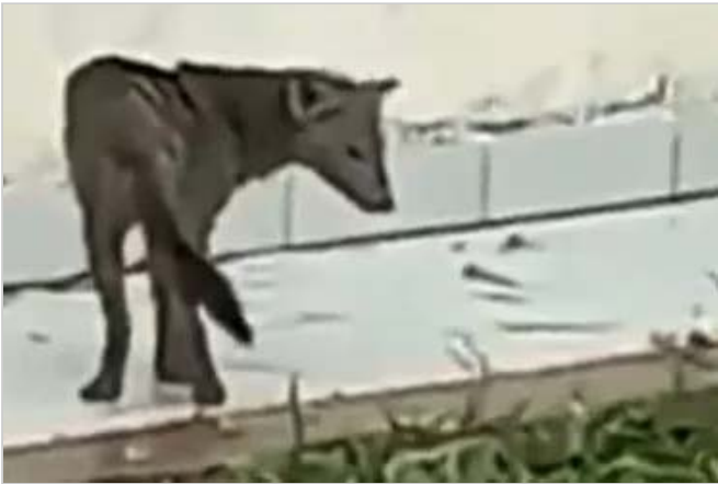
"Perro fantasma". Encontraron vivo a un extraño animal en Bolivia