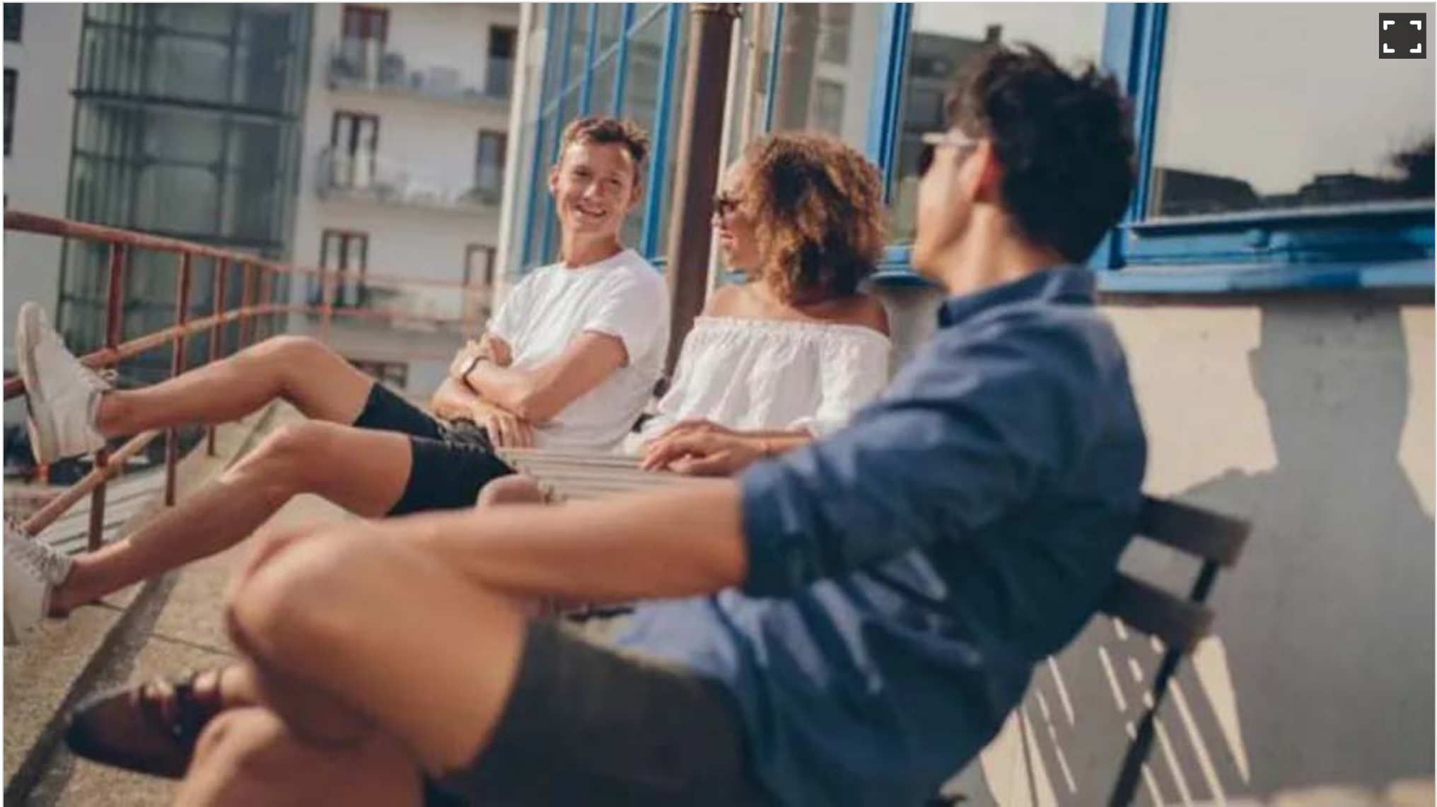
Tres días de fin de semana ayuda a la socialización

Así que tres días de fin de semana nos daría más tiempo para actividades sociales, cuidar a los niños y personas mayores, así como comprometernos más con la comunidad.