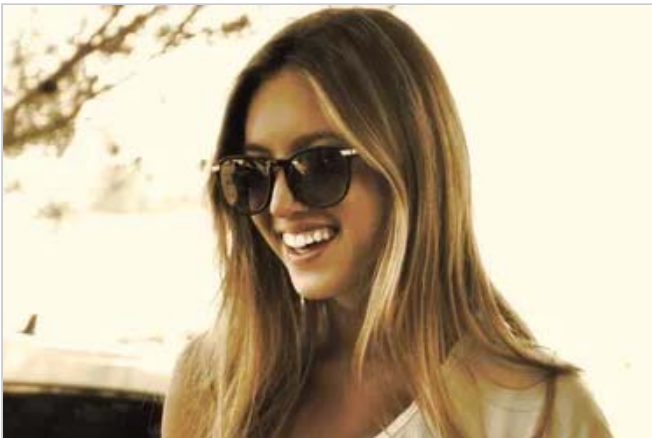
“Cuídate y cuida a tus seres queridos”. Dolor por la muerte de una conocida tiktokker de La Plata