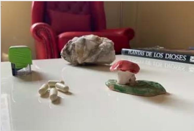
Microdosis de hongos. De los rituales clandestinos a la evidencia médica, la terapia con alucinógenos ya está en el país